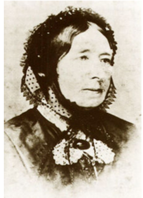
Johanna Friederika Henriette Katharina Davidis