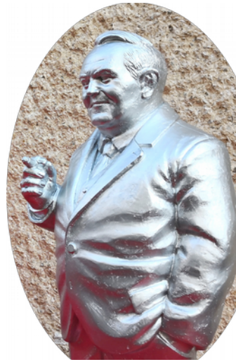
Ottmar Hörl: Ludwig-Erhard-Figur

Ludwig Erhard * 4. 2.1897 in Fürth; † 5. 5.1977 in Bonn