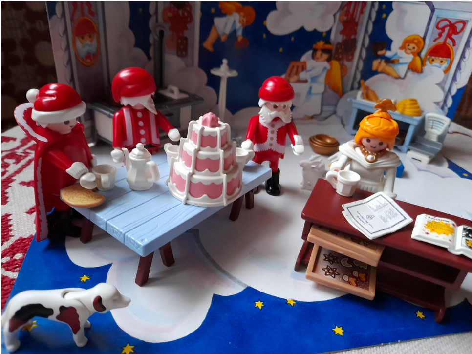
Manöver-Kritik in der Weihnachtsbäckerei

Wir wünschen Euch ein fröhliches und gesundes neues Jahr 2022!